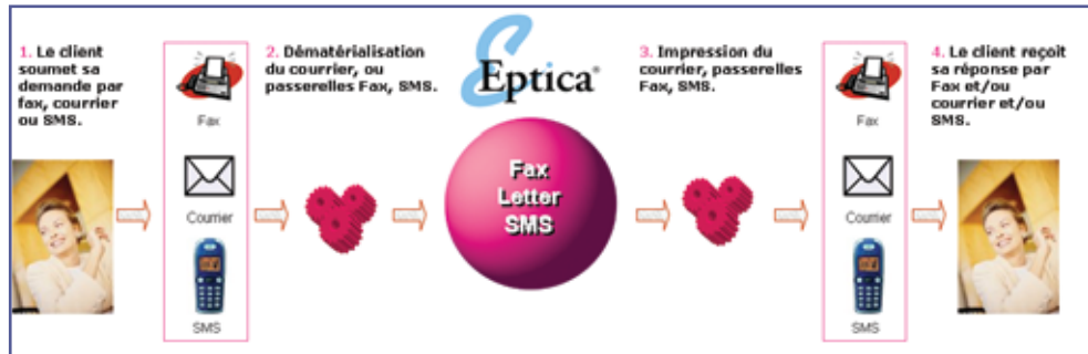
Gestion des demandes clients par fax, courrier et SMS.

Ces technologies tierces d'indexation optimisent la qualification de la demande pour une automatisation plus intelligente des processus de traitement des réponses.